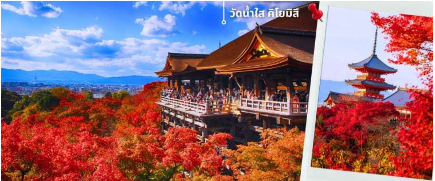
วัดน้ำใส คโยมิสึ

*ระยะเวลาการเปลี่ยนสีของใบไม้จะขึ้นอยู่กับสายพันธุ์และสภาพอากาศ*