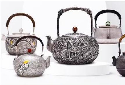
พิพิธภัณฑทำเครื่องเงินมองโกล