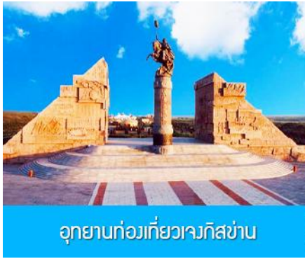
อุทยานท่องเที่ยวเวงกิสข่าน