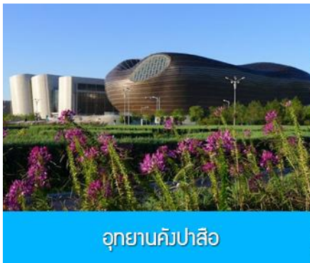
อุทยานคังปาสิอ