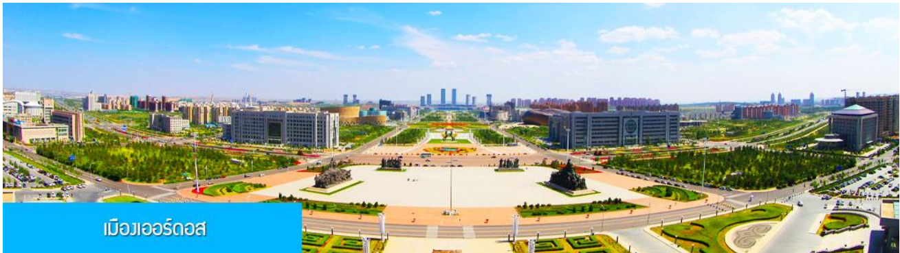
เมืองเออร์ดอส