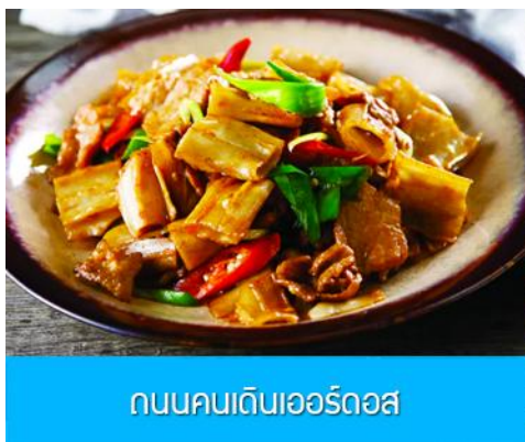
ถนนคนเดินเออร์ดอส

จากนั้นนำท่านเที่ยวชม อุทยานคังปาสิอ 康巴什景区 เป็นเขตเมืองใหม่ที่ถูกเนรมิตรขึ้นและได้รับการขึ้นทะเบียนเป็นอุทยานท่องเที่ยวระดับ 4A และเป็นศูนย์กลางความเจริญของเมืองเออร์ดอส ประกอบด้วยจัตุรัส ธีมปาร์ค พิพิธภัณฑ์ แกรนด์เธียร์เตอร์ ศูนย์วัฒนธรรม และสนามแข่งรถนานาชาติ นำท่านนั่งรถผ่านชมจัตุรัสรัฐบาล ทะเลสาบอูหลันมู่ สวนศิลปะงานปาติมากรรมเอเชีย ฯลฯ