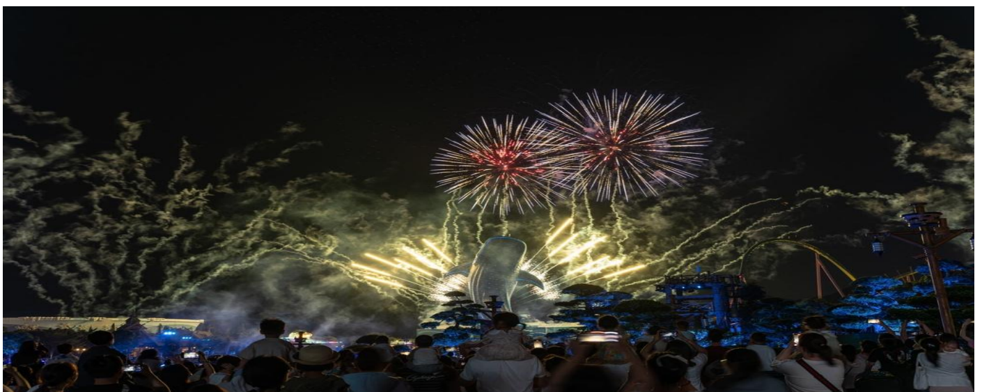
เจตสิกและการแสดงพลุในยามค่ำคืน

Hengqin Ocean โซนกลางสวนสนุก ศูนย์รวมเครื่องเล่นระดับโลก มีขบวนพาเหรดสัตว์ ทะเล มีการแสดงกลางน้ำ โชว์