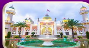
ชมมัสยิดกลางปัตตานี