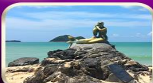
เที่ยวหาดสมิหลา สงขลา