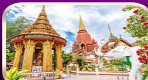
ขอพรหลวงปู่ทวด วัดช้างให้