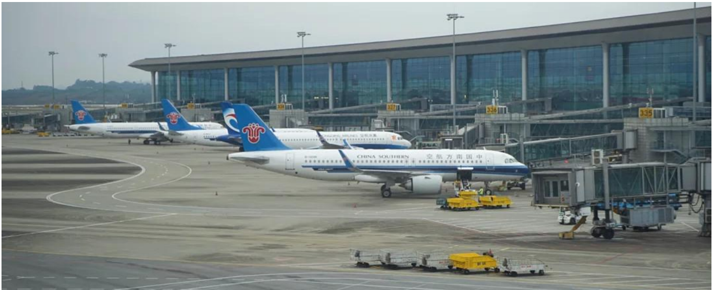
2UCKG-CZ005 บินตรงฉงชิ่ง ฟรีคอม ฟรีเดย์ สนุกสุดคุ้ม มหานครแปดมิติ 5 วัน 3 คืน โดยสายการบิน ไชน่า เซาเทิร์น (CZ)

00.30 น. ออกเดินทางจาก ท่าอากาศยานสุวรรณภูมิ อาคาร สู่ สนามบินฉงชิ่งเจียงเป่ย์ โดย สายการบิน ไชน่า เซาเทิร์น เที่ยวบินที่ CZ2362 05.00 น. เดินทางถึง ท่าอากาศยานนานาชาติสนามบินฉงชิ่ง เจียงเป่ย์ เมืองฉงชิ่ง มหานครที่ถูกสร้างขึ้นโดยทำหายทุกกฎเกณฑ์ของแรงโน้มถ่วงและภูมิศาสตร์ "เมืองภูเขา" ที่เติบโตและซ้อนทับกันเป็นชั้นๆ ตามหุบเขาและริมแม่น้ำ จนได้รับสมญานามสมัยใหม่ว่าเป็น "มหานคร 3 มิติสุดมหัศจรรย์" เมืองที่ท่านจะรู้สึกเหมือนหลุดเข้าไปในฉากภาพยนตร์ไซไฟ ที่ซึ่งชั้น 1 ของตึกหนึ่งอาจเชื่อมต่อกับชั้น 20 ของตึกข้างๆ, ที่ที่ท่านจะได้เห็นรถไฟฟ้าวิ่งทะลุกลางตึกอพาร์ทเมนต์, และที่ที่ Google Maps อาจต้องยอมแพ้ให้กับความซับซ้อนของถนนหนทางที่สร้างทับกันไปมาถึง 5 ระดับ จากนั้นนำท่านผ่านขั้นตอนตรวจคนเข้าเมือง รับกระเป๋าสัมภาระแล้ว นำท่านออกเดินทางเข้ารับประทานอาหารเช้า