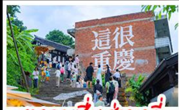
ตรอกเซี่ยฮ่าวหลี่