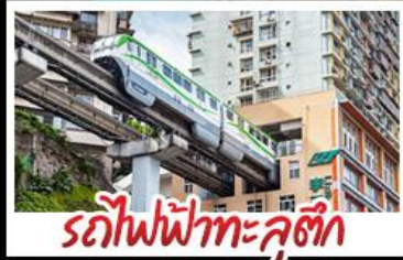
รถไฟฟ้าทะลุคอก