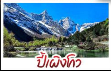
ปี่เป็งโกว