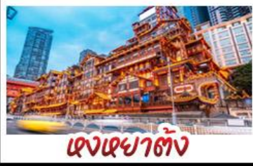
แสงเซาตัง