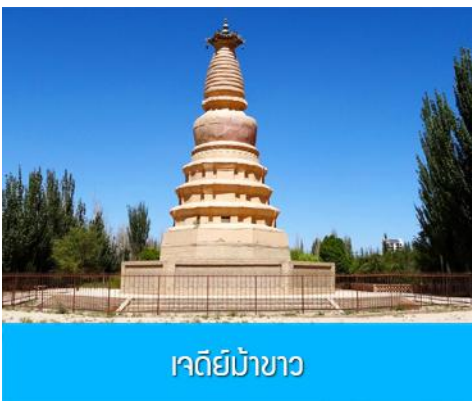
เจดีย์ม้าขาว

เที่ยง รับประทานอาหารกลางวัน ณ ภัตตาคาร (10)