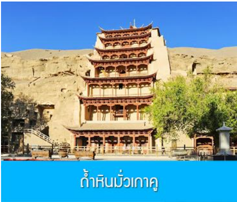
ถ้ำหินมั่วเกาถู

เช้า รับประทานอาหารเช้า ณ ห้องอาหารของโรงแรม (9)