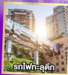
รถไฟฟ้า-ลุดัก