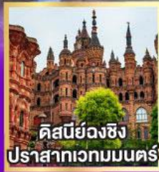
คิสนียงซิ่ง ปราสาทเวทมนตร์