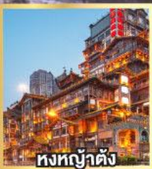
หงทงฮ้างตั้ง