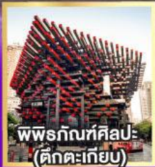
พิพิธภัณฑ์ศิลปะ (ตึกตะเกียบ)