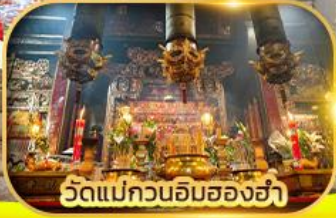
วัดแม่กวนอิมสองฮ่า