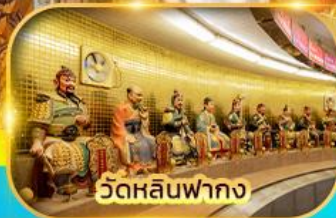
วัดหลินฟากง