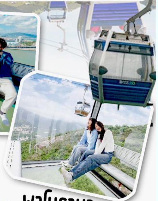
พานิราม่า