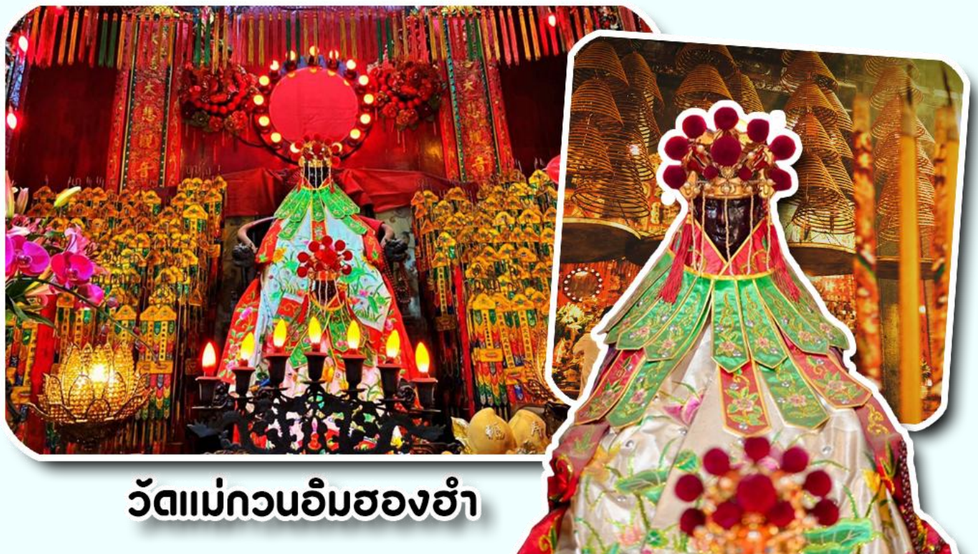
วัดแม่กวนอิมสองฮ้า

จากนั้นพาท่านเข้าไปไหว้ขอพร วัดแม่กวนอิมสองฮ้า วัดเก่าแก่ของฮ่องกงสร้างตั้งแต่ปี ค.ศ. 1873 เป็นวัด ขนาดเล็กที่มีชาวฮ่องกงศรัทธานับถือกันเป็นอย่างมากวัดแห่งนี้เป็นที่ประดิษฐาน องค์เจ้าแม่กวนอิมสองฮ้า ที่มี ชื่อเสียงเรื่องการให้กู้ยืมเงินเชื่อกันว่าท่านช่วยพลิกฟื้นเศรษฐกิจของชาวฮ่องกง ผู้คนจึงนิยมมาเยี่ยมเงินทำธุรกิจจนสำเร็จ ร่ำรวย รุ่งเรืองโดยให้ท่านอธิษฐานขอพรต่อหน้า เจ้าแม่กวนอิมสองฮ้าพร้อมกับระบุวันเวลาในการขอพรด้วย จากนั้นนำ ธูปธูปตามฐานะและศรัทธาที่เราจะนำเป็นสื่อในการขอพร เขียนจำนวนเงินที่ต้องการลงไปด้วย ใส่สกุลเงินยิ่งดีใหญ่ แล้ว นำเงินใส่ในซองแดง ควรเตรียมซองแดงไปเอง นำซองแดงไปวนรอบกระถางรูป วนขวาจำนวน 3 ครั้ง แล้วเก็บซองแดงใน กระเป๋าสตางค์ เป็นเงินขวัญถุง ถ้าประสบความสำเร็จตามที่มุ่งหวัง ให้นำเงินในซองแดงทำบุญหยอดตู้ที่วัดแห่งนี้ในโอกาส ต่อไป