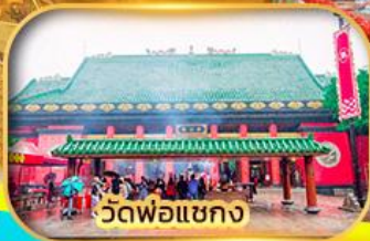
วัดฟ้อแซก