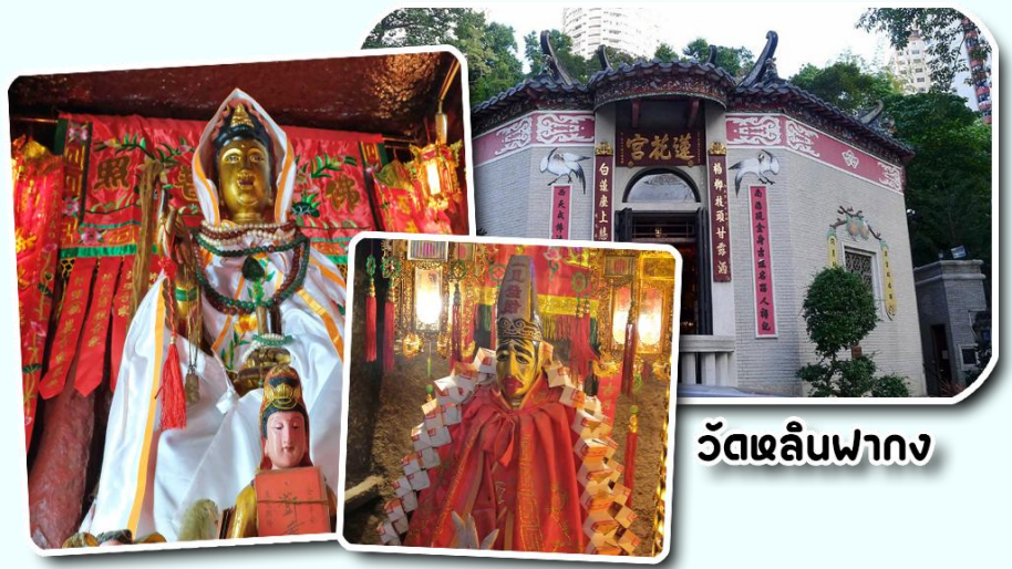
วัดหลินฟาง

นอกจากนี้ทางวัดหลินฟ้าก็ยังมี เทพเจ้า ฮั่วจื่อเฮียะ หรือเทพเจ้าสายนรก เป็นเทพ เจ้าที่ขึ้นชื่อเรื่องกตัญญูที่มาในรูปลักษณะ การนุ่งห่ม ผ้าดิบ ซึ่งเป็นสัญลักษณ์ของการ ไว้ทุกข์ที่คนเชื้อสายจีนให้ความสำคัญ เทพ เจ้าองค์นี้ก็เปี่ยมไปด้วยพลังหยิน ซึ่งเป็น ด้านเกี่ยวกับเงินเงินทองทอง สำหรับผู้ที่ ชอบเลี้ยงโชค