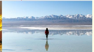
ทะเลสาบซิงไห่

*ทางบริษัทฯ ขอสงวนสิทธิ์ในการสลับโปรแกรมทัวร์ตามความเหมาะสมขึ้นอยู่กับสถานการณ์หน้างาน โดยคำนึงถึงผลประโยชน์ของลูกค้าเป็นสำคัญ