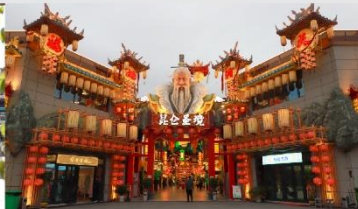
เมืองจำลองวัฒนธรรมคุนหลุน