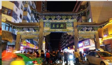
ตลาดกลางคืนถนนม่อเจีย