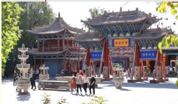
วัดพระใหญ่จางเย่