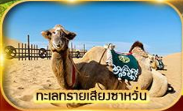
ทะเลทรายเสียซาหวัน