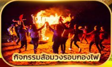
กิจกรรมล้อมวงรอบกองไฟ