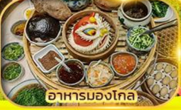
อาหารมองโกเลีย