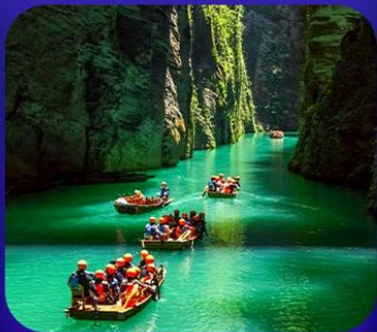
“ ผิงซานแกรนด์แคนย่อน ”

เที่ยวจีน 2 มณฑล เสฉวน+หูเป่ย์ • ถ้าเถิงหลง • หุบเขาสิงโต ซื่อจื่อกวน ล่องเรือมังกรกังสุ่ยชมวิวยามค่ำคืน • ผิงซานแกรนด์แคนย่อน (รวมล่องเรือ) หงหยาดัง • จุดชมรถไฟฟ้าทะเลตึก • ตึกตะเกียบ • สือปาที • หลงเหมินฮ่าว