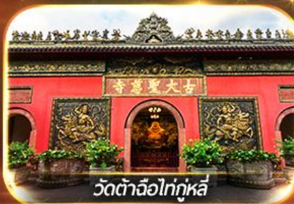
วัดต้าจื่อไท่กุหลี่