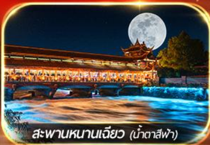
สะพานหนานเจียว (น้ำตาสีฟ้า)