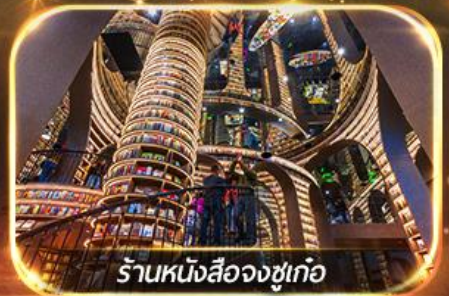
ร้านหนังสือจงซูเกอ

เที่ยวชมทัศนียภาพ 2 อุทยาน บีเฟิงโกว &amp; ชวงเจียวโกว