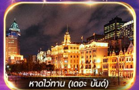
หาดว่ทาน (เดอะ บันด์)

เที่ยวดิสนีย์แลนด์เต็มวัน (รวมรถรับ-ส่ง)