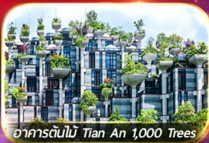
อาคารต้นไม้อัน Tian An 1,000 Trees