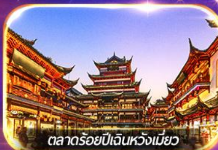
ตลาดร้อยปีเงินหวงเมี่ยว