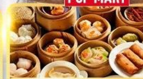
อาหารกวางตุ้ง