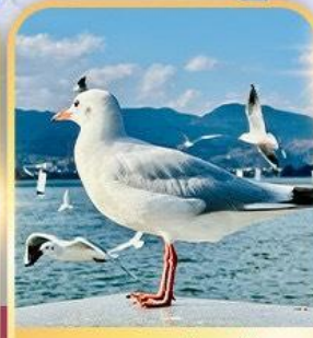
ทะเลสาบเตียนฉือ