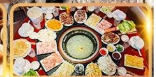
สุกี้เห็ด