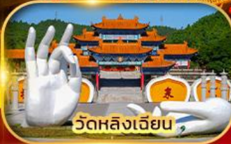
วัดหลิงเจียน