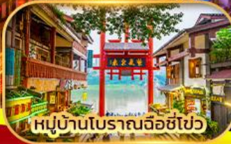
หมู่บ้านโบราณฉือซื่อ