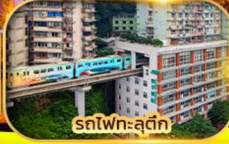
รถไฟทะลุติ๊ก