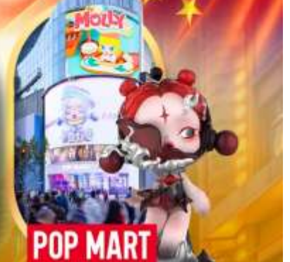
ช้อปปิ้งร้าน Pop Mart