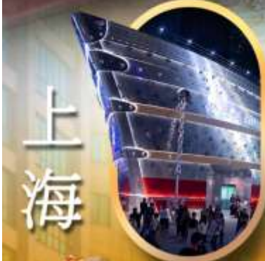
เรือเดอะหลุยส์