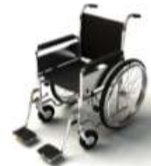
การรับการดูแลเป็นพิเศษ

กรณีผู้เดินทางต้องการความช่วยเหลือเป็นพิเศษ อาทิเช่น การใช้วีลแชร์ กรุณาแจ้งบริษัทฯ อย่างน้อย 7 วันก่อนการเดินทาง มิฉะนั้นบริษัทฯ จะไม่สามารถจัดการล่วงหน้าได้ เนื่องจากการขอใช้วีลแชร์ในสนามบินนั้น ต้องมีขั้นตอนในการขอล่วงหน้า และบางสายการบินอาจมีการเรียกเก็บค่าใช้จ่ายทั้งทางสนามบินในไทยและในต่างประเทศ ซึ่งผู้เดินทางสามารถสอบถามกับเจ้าหน้าที่ได้โดยตรงก่อนทำการจอง และหากในขณะของท่านมีผู้ต้องการดูแลพิเศษ เช่น ผู้ที่นั่งรถเข็น (Wheelchair), เด็ก, ผู้สูงอายุและผู้ที่มีโรคประจำตัวหรือไม่สะดวกในการเดินทางท่องเที่ยวในระยะเวลาเกินกว่า 4 - 5 ชั่วโมงติดต่อกัน ท่านและครอบครัวต้องให้การดูแลสมาชิกภายในครอบครัวของท่านเอง เนื่องจากการเดินทางเป็นหมู่คณะ หัวหน้าทัวร์มีความจำเป็นต้องดูแลคณะทัวร์ทั้งหมด