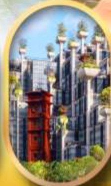
อาคารพินตันไม้