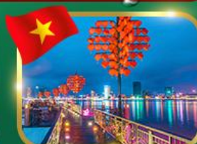
สะพานแห่งความรัก ดานัง