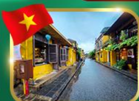
เมืองเก่ามรดกโลก ฮอยอัน