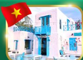
คาเฟ่สไตล์ซานโตรินี่ ซันทรา มาริน่า