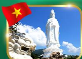
ซอพระองค์ควอนอิม วัดหลินอึ้ง