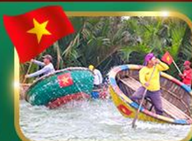
ล่องเรือกระด้ง หมู่บ้านทับทิม