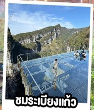
ชมระเบียงแก้ว