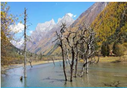
หุบเขาชวงเจียวโกว