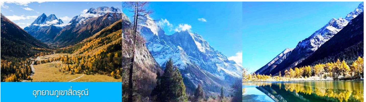
อุทยานภูเขาสิ่ดรุณี