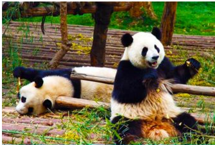
ศูนย์อนุรักษ์หมีแพนด้าเมืองตูเจียงเยียน

หลังอาหารท่านสามารถเลือกที่จะซื้อโปรแกรมทัวร์เสริม หรืออิสระพักผ่อนตามอัชฌาศัยในโรงแรม