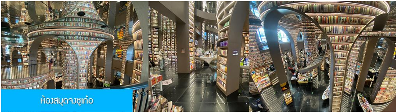
ห้องสมุดวงซูก่อ