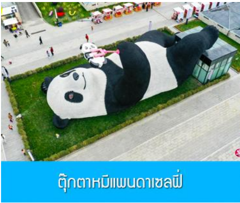
ตุ๊กตาหมีแพนดาเซลฟี่