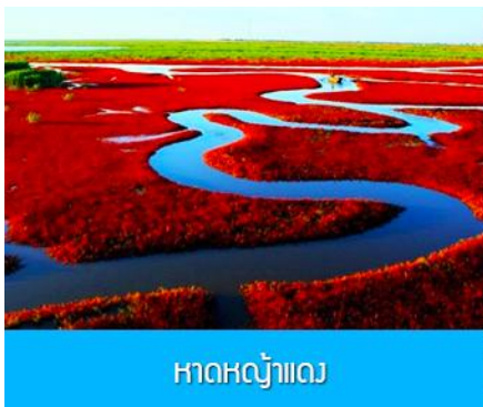
หาดหญ้าแดง