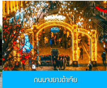
ถนนจงยงต้าเจีย