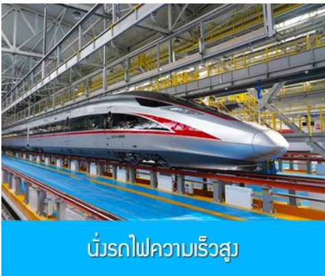
นี่คือรถไฟความเร็วสูง