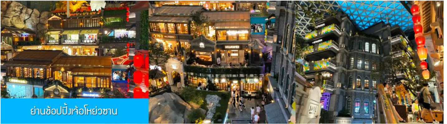
ย่านช้อปปิ้งเจ้อห้วยซาน

นำท่านเที่ยวชม ย่านช้อปปิ้งเจ้อห้วยซาน 这有山 แหล่งช้อปปิ้งขึ้นชื่อที่ผสมผสานระหว่างสถานที่ท่องเที่ยว และแหล่งรวมร้านค้า และร้านอาหารฟาสต์ฟู้ด อาหารพื้นเมืองร่วมสมัย ภายใต้คอนเซ็ปต์ แหล่งช้อปปิ้งบนภูเขา และบนภูเขามีย่านช้อปปิ้ง เป็นจุดเช็คอินยอดนิยมที่เปิดให้คนพื้นที่และนักท่องเที่ยวเข้าชมตั้งแต่ปี ค.ศ. 2019