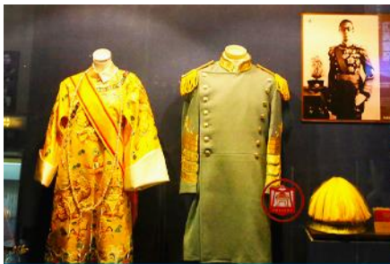
พระราชวังปูยี

รับประทานอาหารเช้า ณ ห้องอาหารของโรงแรม (7)