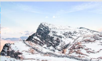
ภูเขาหิมะเจี้ยวจื้อ