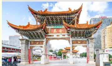
ประตูม้าทองไถ่หยก