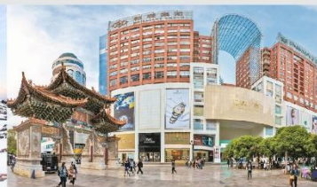
ถนนคนเดินหนานผิงเจีย

*ทางบริษัทฯ ขอสงวนสิทธิ์ในการสลับโปรแกรมทัวร์ตามความเหมาะสมขึ้นอยู่กับสถานการณ์หน้างาน โดยคำนึงถึงผลประโยชน์ของลูกค้าเป็นสำคัญ