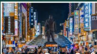
ถนนแดนดินเซวซิงซู่