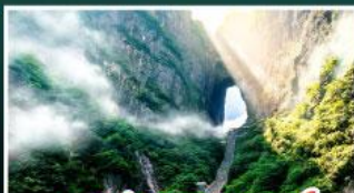
เขาประตูสวรรค์