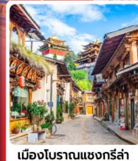
เมืองโบราณแชนกรีล่า