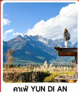
คาเฟ่ YUN DI AN