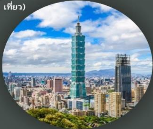
ตึกไทเป 101 (ขึ้นชั้น 89)