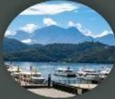
ทะเลสาบสุริยันจันทรา (รวมสองเรือ)