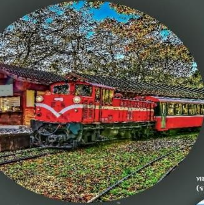
อุทยานอาลีซาน (รวมนั่งรถไฟ 1 เที่ยว)