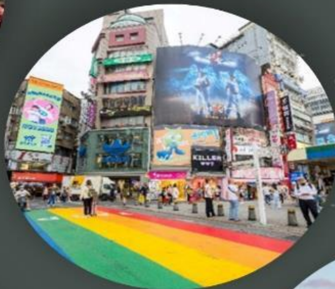
ซีเหมินติง ไนท์มาเก็ต