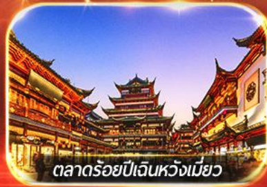
ตลาดร้อยปีเงินหวังเมี่ยว

เช็กอินหาดไว่ทาน ถ่ายรูปมุมฮิต หอไข่มุก + ตึกยุโรป (เดอะบันด์) ขอพรแก่ขงวัดพระหยกขาว ช้อปปิ้งจู่จี้ ถนนนานกิง, ตลาดโตรุ่งอู่หลิน