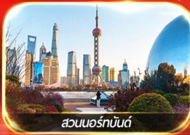
สวนออร์ทันด์