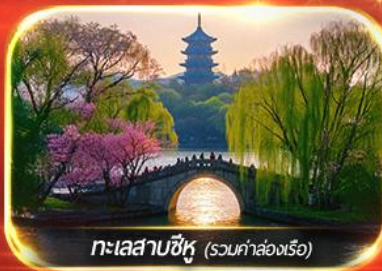
ทะเลสาบซีหู (รวมท่าล่องเรือ)