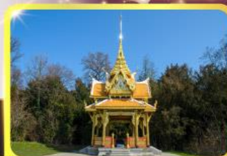
ศาลาไทยไชยาพันธ์

GO3CDG-TG058 • ชมมหาวิหารแห่งเมืองมิลาน 8 วัน | 5 คืน