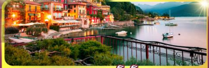
ทะเลสาบโลโบ

เดินทาง : 11-18 มิ.ย. 69 / 25 มิ.ย. - 02 ก.ค.69 02 - 09, 16-23 ก.ย.69 / 07 -14, 22-29 ต.ค.69 04 - 11, 11-18 พ.ย.69 25 พ.ย. - 02 ธ.ค.69 03 - 10, 23-30 ธ.ค.69 / 23 - 30 ธ.ค. 69 29 ธ.ค.69 - 05 ม.ค.70