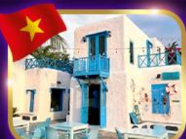
คาเฟ่สุดชิค ซานทรา บาร์น่า