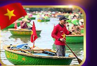
เรือกระด้ง หมู่บ้านกัมთან