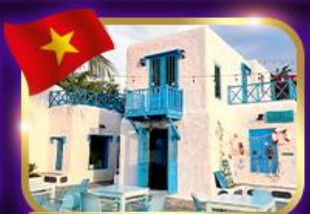
คาเฟ่สุดชิค ชานตรา มาริน่า