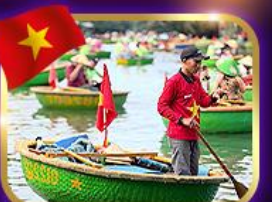
เรือกระด้ง หมู่บ้านกิมทาน