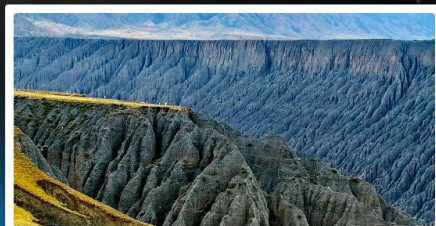
แกรนด์แคนยอนคู่ซานจื่อ