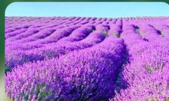
ทุ่งลาเวนเดอร์