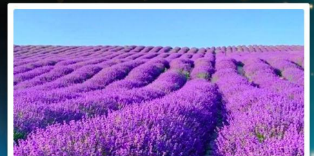
ทุ่งลาเวนเดอร์