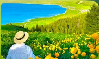
ทะเลสาบไซท์ลี่มู่