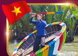
ล่องเรือกระดัง หมู่บ้านกัมทาม