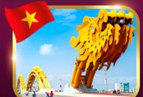
แลนด์มาร์กสะพานมังกร ดานัง