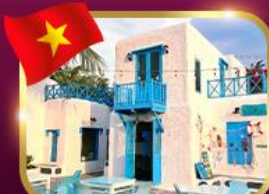
คาเฟ่สไตล์ชาบิโตรมี ซันตรา บาร์น่า