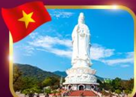
ซอพรองค์ควอนฮิม วัดหลิมฮิ่ง