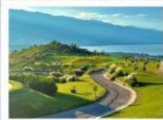
ภูเขาวันเซียงซาน