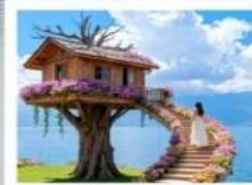
หมู่บ้านเหวินปี้