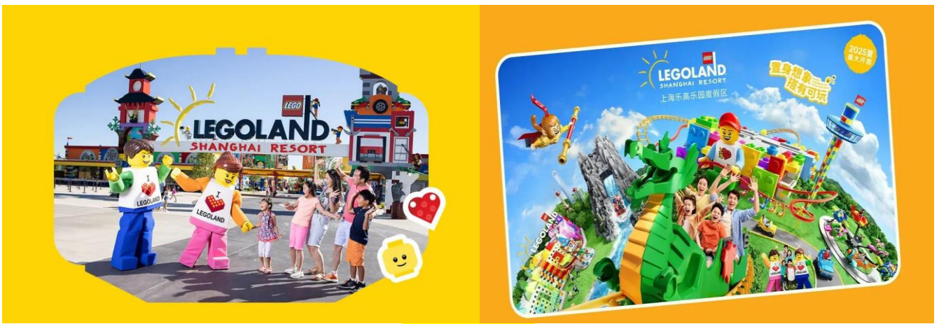
ไฮไลท์ของสวนสนุก

08.00 น. รถโค้ชนำท่านเดินทางสู่ SHANGHAI LEGOLAND (เปิดใหม่!) "ดินแดนเลโก้แห่งแรกของโลกที่ผสมวัฒนธรรมจีนอย่างลงตัว" ครั้งแรก ของโลกกับ LEGOLAND ที่ไม่เหมือนที่ใดในโลก! เปิดประสบการณ์ใหม่กับโซน Monkie Kid ที่ได้แรงบันดาลใจจาก ไซอิ๋ว พร้อมล่องเรือชมงาน วัฒนธรรมเจียงหนานสุดสงบ แต่เต็มไปด้วยดีเทลเลโก้สุดล้ำ เทียบ Miniland แลนด์มาร์กจีนย่อส่วนอย่างกำแพงเมืองจีน-หอไข่มุกที่ใช้เลโก้กว่า 36 ล้านชิ้น และชมโชว์หุ่นยนต์ Bull Demon King ขนาดยักษ์ที่ขยับจริงโดยนักเชิดมี้อาชีพ!