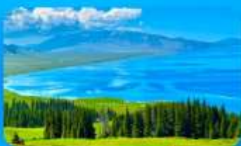
ทะเลสาบไซ่หลี่มู่