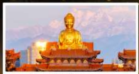
วัดพระใหญ่ทองกงซาน