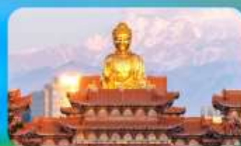
วัดพระใหญ่หวงกงซาน