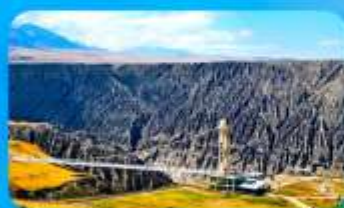
แกรนด์แคนยอนคูซานจื่อ