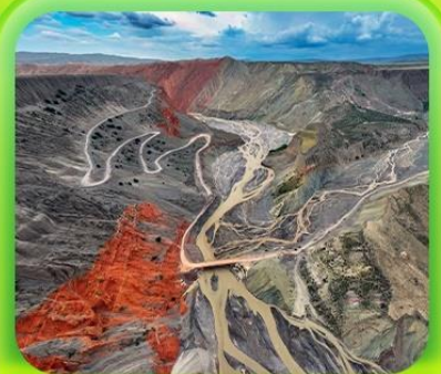
"แกรนด์แคนยอนคู่ชานโจ้ว"

ซินเจียงเหนือ ทะเลสาบโซลิมู่ "น้ำตาหยดสุดท้ายของแอตแลนติก" • ทุ่งหญ้านาราตี ทุ่งดอกไม้เทียนซาน • ผ่านชมสะพานกั๋วจื่อโกว • ถนนหลิวซิงเจียง • ตลาดต้าปาจา