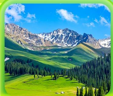
"ทุ่งหญ้านาราตี"