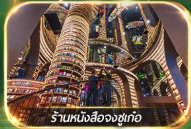
ร้านหนังสือจางซูเกอ

เที่ยวชม 2 อุทยาน ปี้เฟิงโกว & จิวจ้ายโกว (รถเหมา) เชคอินแพนด้าเซลฟ์ & แพนด้าปิ่นตึก, ซอปปิงที่ถนนคนเดินซุนซีลู่, POP MART