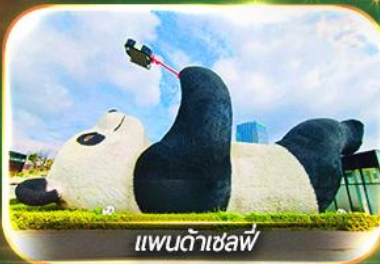
แพนด้าเซลฟ์