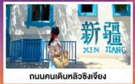
ถนนคนเดินหลิวซิงเจียง