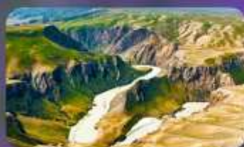
แกรนด์แคนยอนคูซานจื่อ