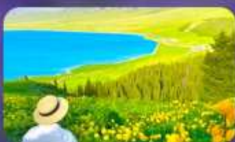
ทะเลสาบไซ่หลี่มู่