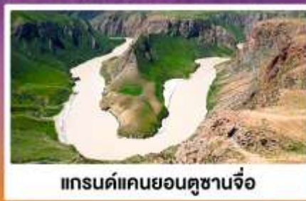
แกรนด์แคนยอนคูซานจื่อ