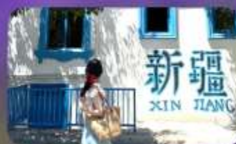
ถนนคนเดินหลิวซิงเจียง