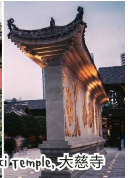
Daci Temple, 大慈寺