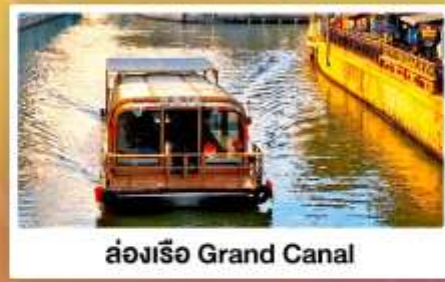
ล่องเรือ Grand Canal