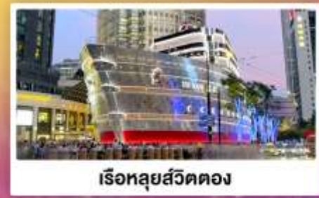
เรือทูลย์สัตว์ตอง