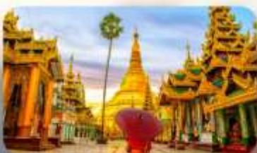
วัดจิ่งอัน