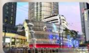
เรือหลุยส์วิตตอง