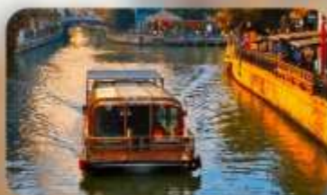
ล่องเรือ Grand Canal