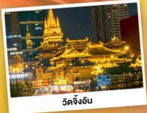
วัดจิ่งอัน

เที่ยว 2 เมือง หางโจว-มหานครเซี่ยงไฮ้ ตะลุยเมืองซูโหมเปียว ชมพุลดิสนีย์แลนด์สุดอลังการ