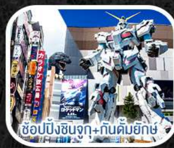
ช้อปปิ้งชินจูกุ+กันดั้มยักษ์