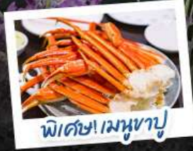
พิเศษ! เมงูซาซู