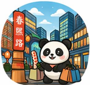
ถนนคนเดินชุนซีลู่ (Chunxi Road)

จากนั้นอิสระท่าน ถนนคนเดินชุนซีลู่ ย่านช้อปปิ้งชื่อดังและคึกคักที่สุดของเฉิงตู เต็มไปด้วยห้างสรรพสินค้า ร้านแบรนด์ดัง ร้านอาหาร และสตรีทฟู้ด เหมาะสำหรับช้อปปิ้งและสัมผัสวิถีชีวิตคนเมือง และ ถนนคนเดินไท่กู่หลี่ แหล่งช้อปปิ้งไลฟ์สไตล์สุดทันสมัย ผสมผสานสถาปัตยกรรมจีนโบราณกับดีไซน์โมเดิร์นอย่างลงตัว รายล้อมด้วยร้านค้าแบรนด์ดัง คาเฟ่ และมุมถ่ายรูปสวยๆ มากมาย