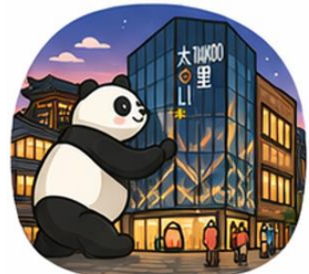
ถนนคนเดินไท่กู่หลี่ (Taikoo Li)

จากนั้นอิสระท่าน ถนนคนเดินชุนซีลู่ ย่านช้อปปิ้งชื่อดังและคึกคักที่สุดของเฉิงตู เต็มไปด้วยห้างสรรพสินค้า ร้านแบรนด์ดัง ร้านอาหาร และสตรีทฟู้ด เหมาะสำหรับช้อปปิ้งและสัมผัสวิถีชีวิตคนเมือง และ ถนนคนเดินไท่กู่หลี่ แหล่งช้อปปิ้งไลฟ์สไตล์สุดทันสมัย ผสมผสานสถาปัตยกรรมจีนโบราณกับดีไซน์โมเดิร์นอย่างลงตัว รายล้อมด้วยร้านค้าแบรนด์ดัง คาเฟ่ และมุมถ่ายรูปสวยๆ มากมาย