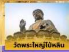
วัดพระใหญ่โป้หลิน