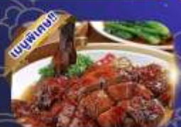
เปิดเช้าฮ่องกง