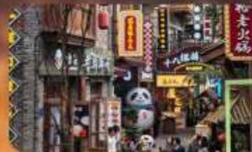
หมู่บ้านสีโอปาที้