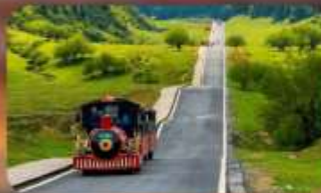
หุบเจานางฟ้า