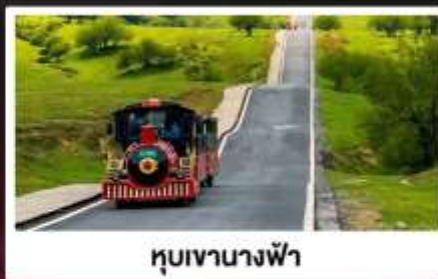
หุบเขานางฟ้า