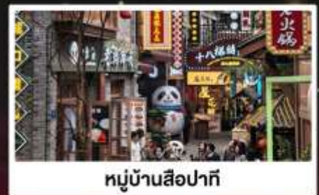
หมู่บ้านสีปาที้