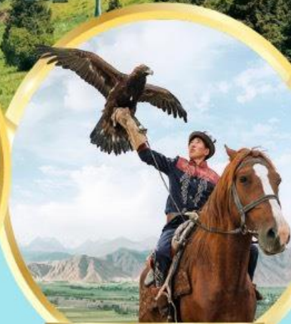
ชมโชว์นกอินทรี