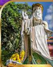
เจ้าแม่กวนอิม สวีตสปัน