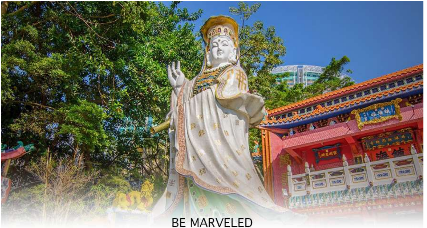
BE MARVELED วัดเจ้าแม่กวนอิมริปลัสเบย์