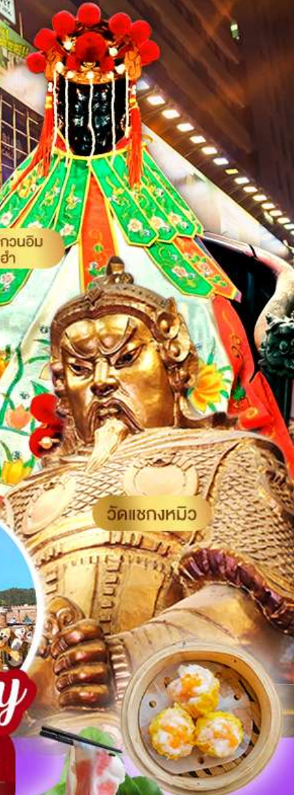
วัดเจ้าแม่กวนอิม ฮองซา