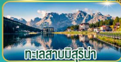
ทะเลสาบบิสูร์น่า