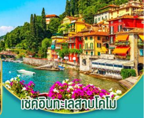
เชคอินทะเลสาบโคโม