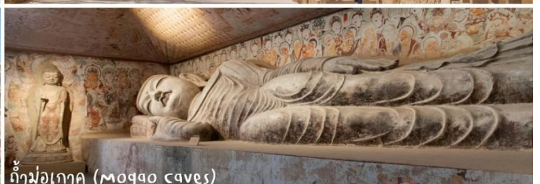
ถ้ำม่อเกาคุ (Mogao caves)