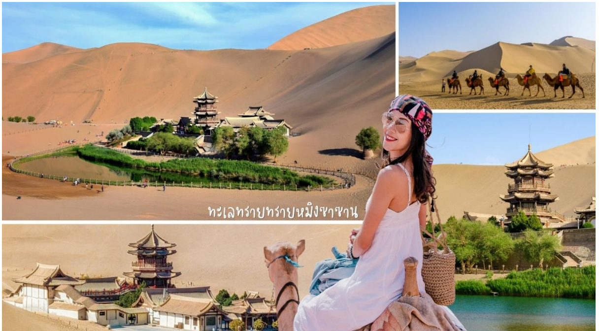
ทะเลทรายนมิงซาซาน