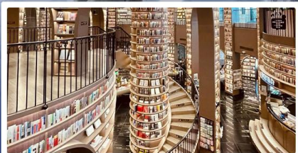
ร้านหนังสือจุงชู่เก๋อ