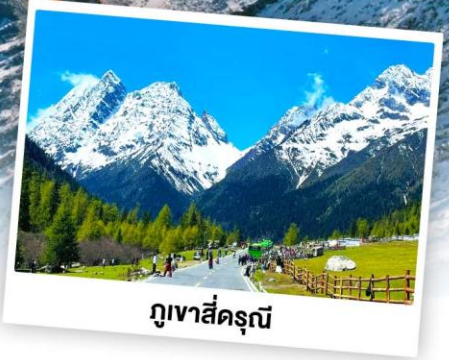
กุเวาสีครุณี

เดินทางโดย: สายการบินเจียงตูแอร์ไลน์ (EU)