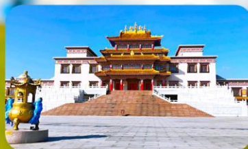
คฤหาสน์พุทธบูชาแห่งชีวิคยูลาน