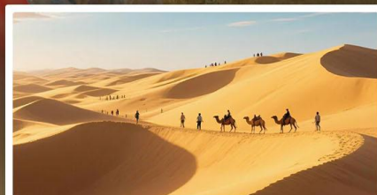
เนินทรายอินเคินทาลา