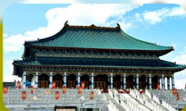
พระราชวังต้องห้ามออร์ดอส