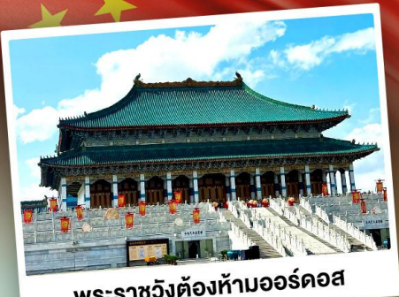
พระราชวังต้องห้ามออร์ดอส

ตะลุยเนินทรายร้องเพลง แห่งมองโกเลียใน ชมวิวทุ่งหญ้าโล่งกว้างตัดขอบฟ้าคราม