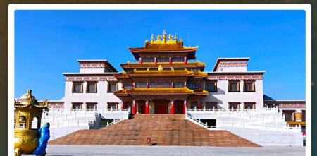
คฤหาสน์พุทธบูชาแห่งชีวิตยูลาน