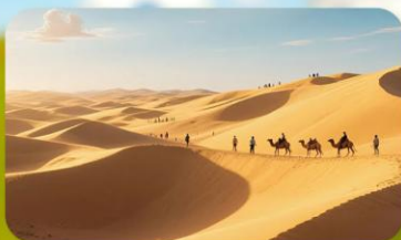
เนินทรายอินเคินทาลา