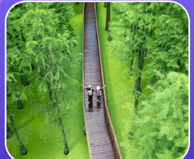
“ป่าสนชิงซาน”