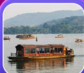
“ล่องเรือทะเลสาบซีหู”