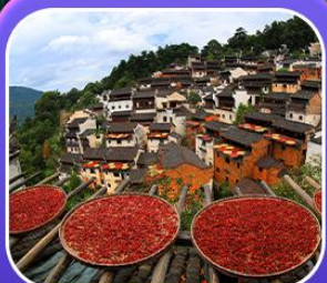
“หมู่บ้านหลงหลิง”

หุบเขาเทวดาฉีเจียงหนู่ หมู่บ้านที่ตั้งอยู่ริมหน้าผา • หมู่บ้านโบราณหลงหลิง ป่าสนน้ำชิงซาน • ล่องเรือทะเลสาบซีหู • ถนนโบราณตุ๋นเจ้อ • ชมแสงสีที่ อุ๋นนี่โจว