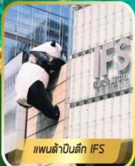
แพนด้าป็นตึก IFS