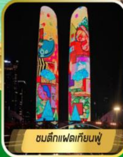
ชมตึกแพดเทียนฟู